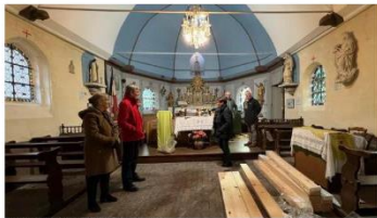
Un dimanche, moment exceptionnellement paisible au village.