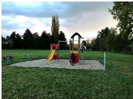
Aire de jeux des « Jardins de la Tour »

Nous en avons profité pour rénover les anciens buts et poser un pare ballon (les divers filets seront posés prochainement).