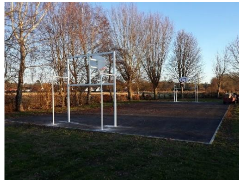
City stade « Clos Henri FARCY »